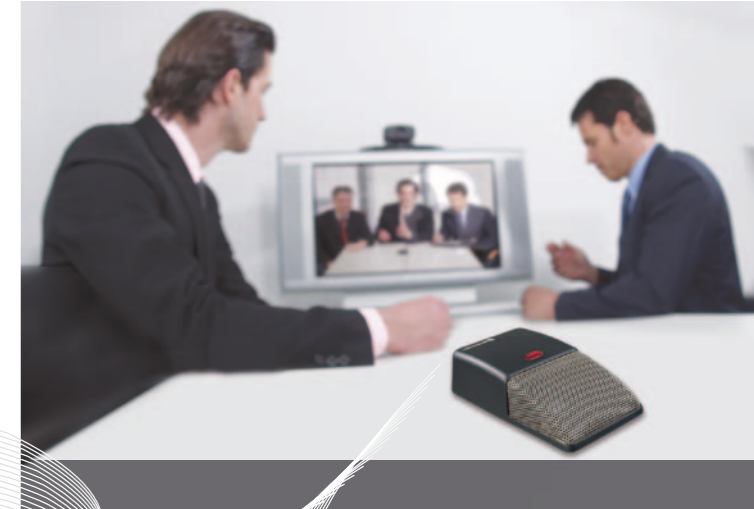
STEGOS – MICRÓFONO BOUNDARY INALÁMBRICO

PARA MÁS INFORMACIÓN, VISITE WWW.BEYERDYNAMIC-ES.COM